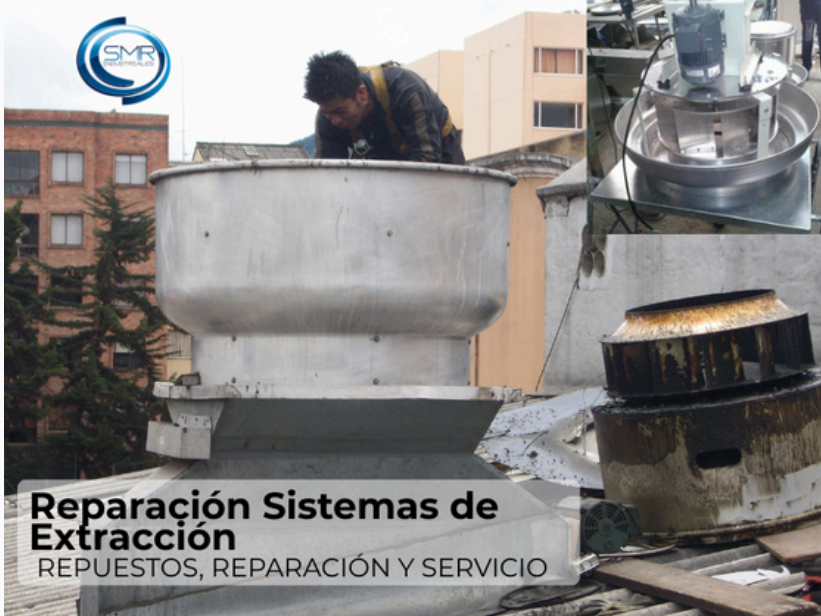
Reparación Sistemas de Extracción REPUESTOS, REPARACIÓN Y SERVICIO

Nuestros servicios garantizan el óptimo funcionamiento de tus sistemas: